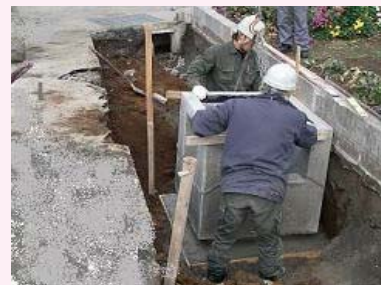
ベースコン打設・柵設置