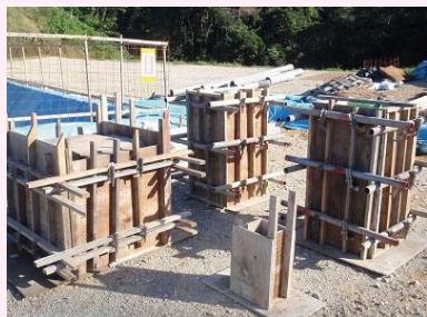
型枠組立・生コン打込み