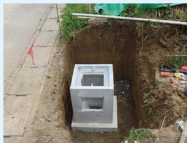
柵設置・インパットコンクリート打込み