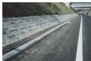
高速道路での防火帯の事例(上信越自動車道)